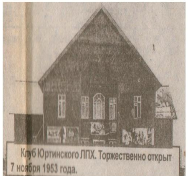
Клуб Юртинского ЛПХ. Торжественно открыт 7 ноября 1953 года.