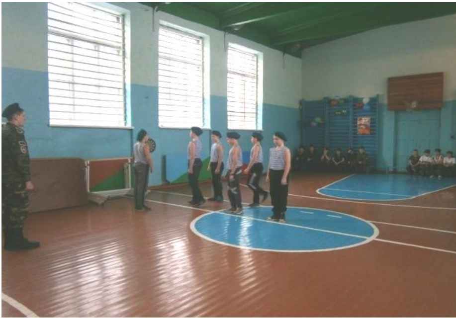
Конкурс «Хоть пока мы и малы, но для армии годны!»