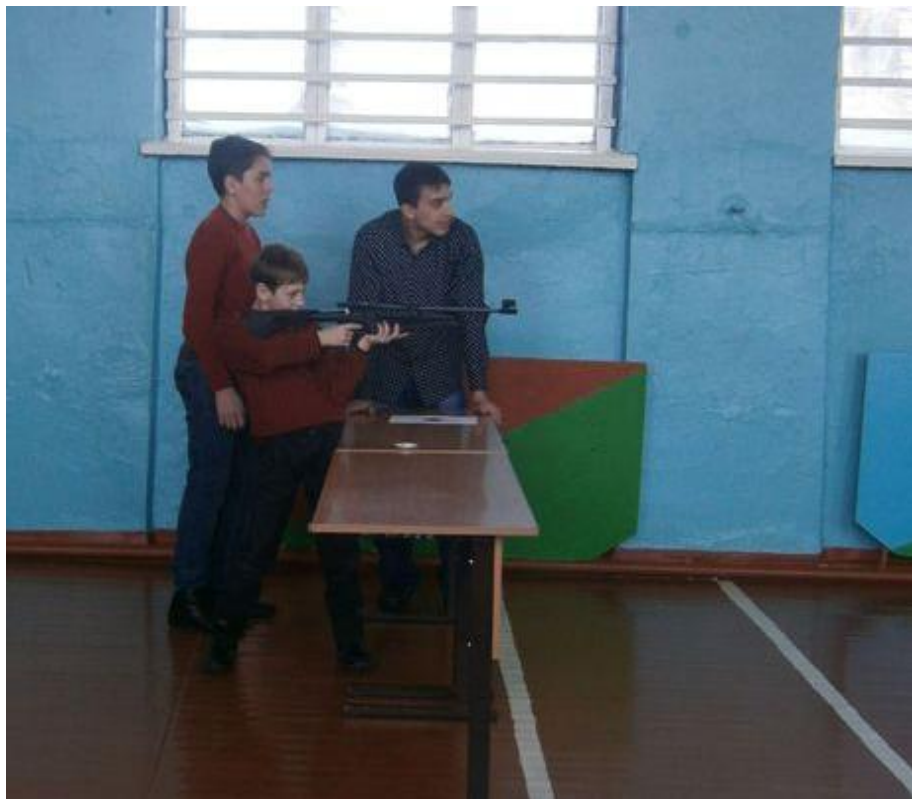
Соревнование по стрельбе «Меткий стрелок»