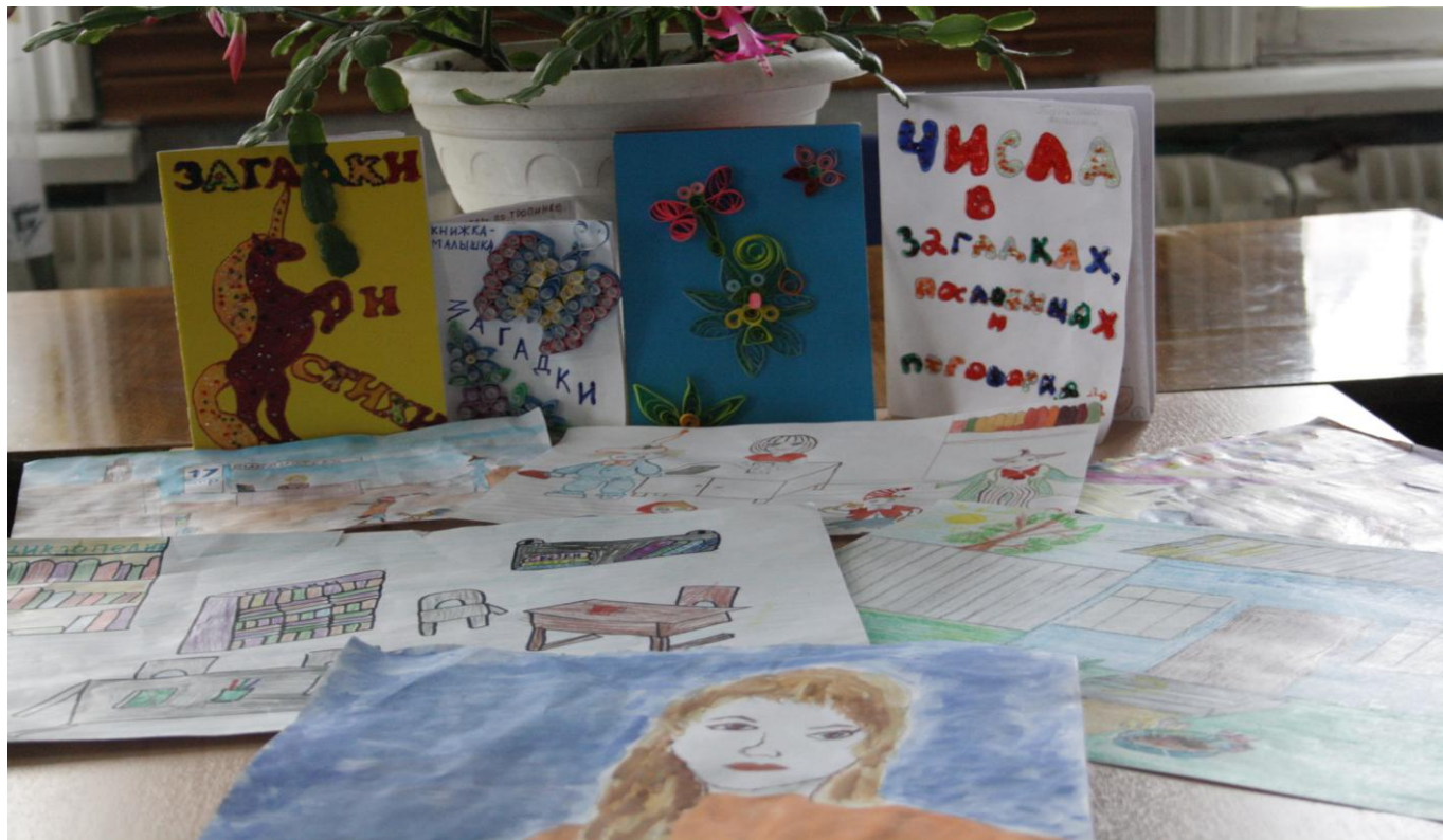
Выставка творческих работ детей конкурса