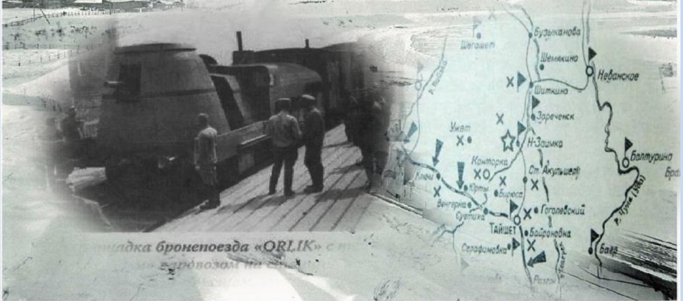
Площадка бронепоезда «ORLIK» с теплушкой и «чёрным» паровозом на станции Юрты