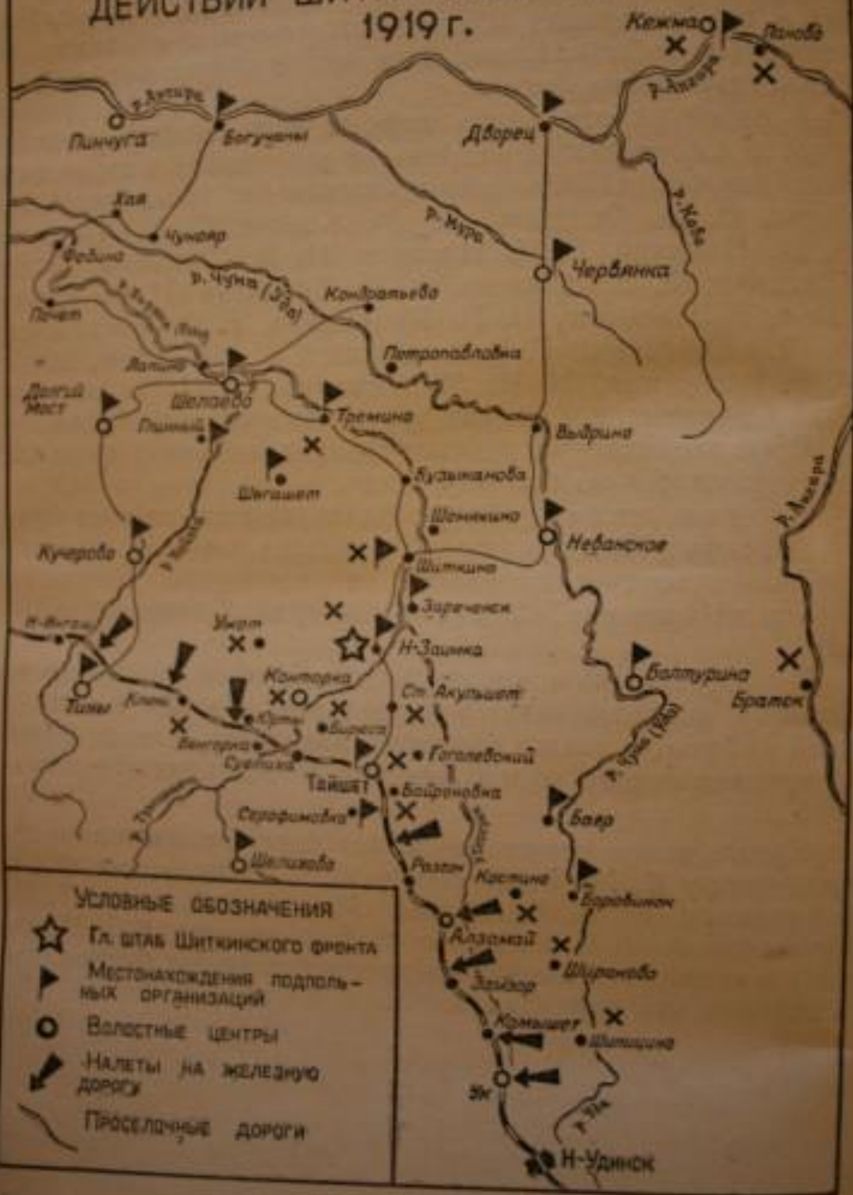
Карта-схема Шиткинского фронта в 1919 г.