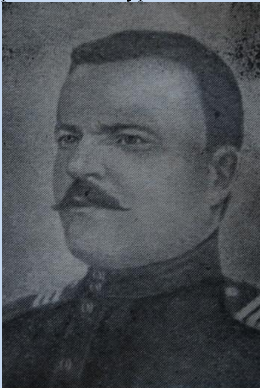
М. Н. Никитин (фото 1917 г.)