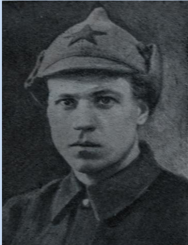
И. А. Осипенко (фото 20-х г.)