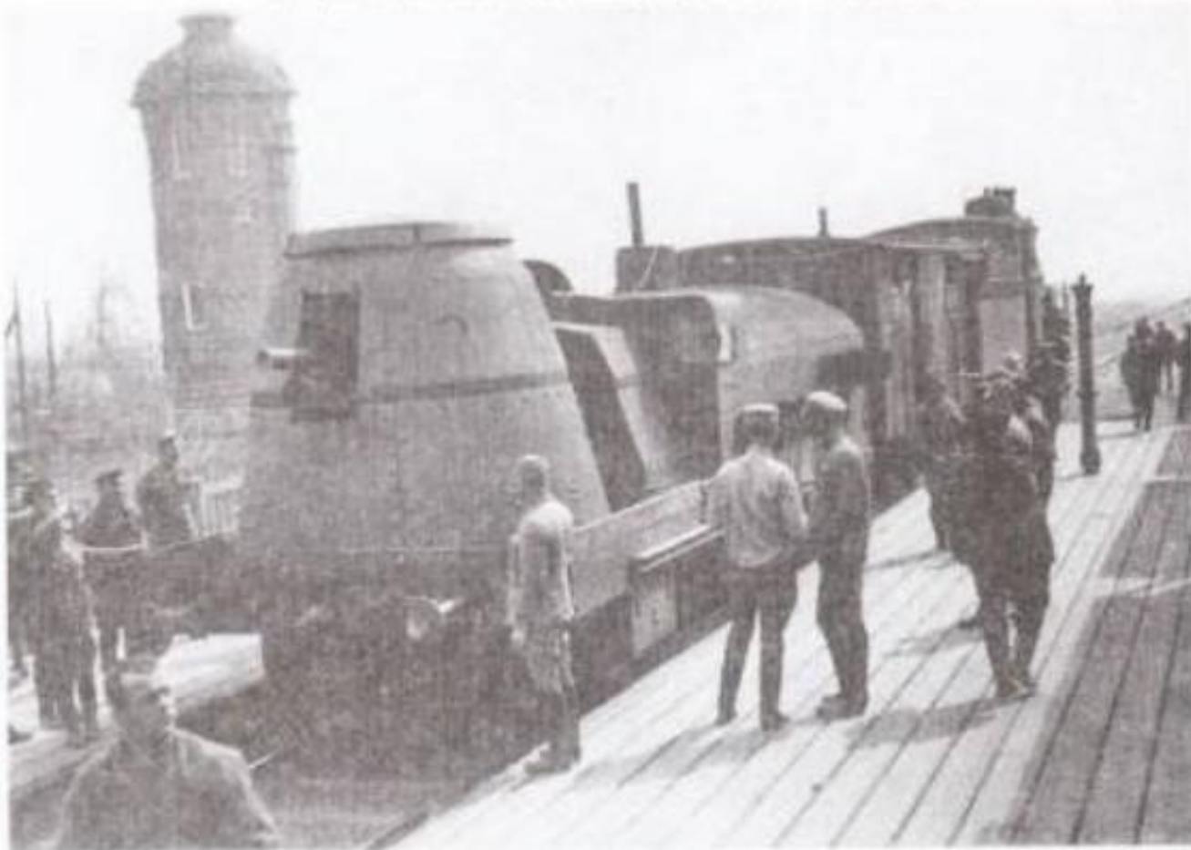
Бронеплощадка бронепоезда «ORLIK» с теплушкой и «чёрным» паровозом на станции Юрты под Тайшетом, 1919 год.